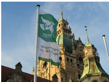
Le drapeau des Maires pour la Paix devant l'Hôtel de Ville de Hanovre