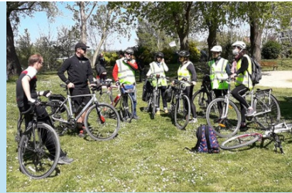
Les gennevilloise.ses à l'entraînement