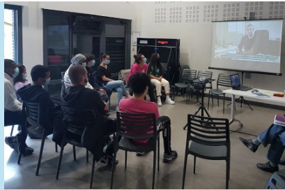
Présentation de la vidéo de l'AFCD RP