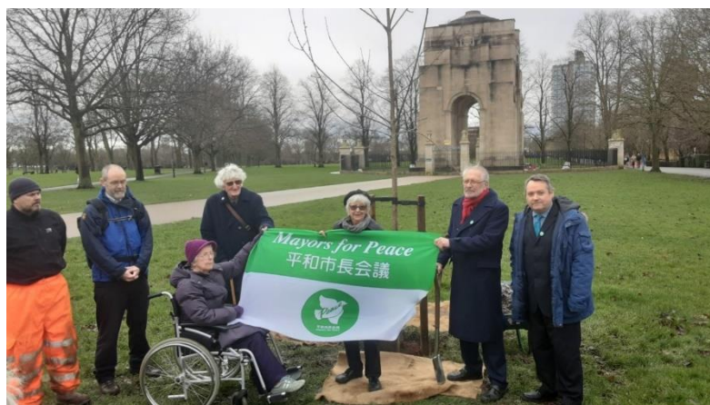
Plantation d'un arbre de la paix à Leicester