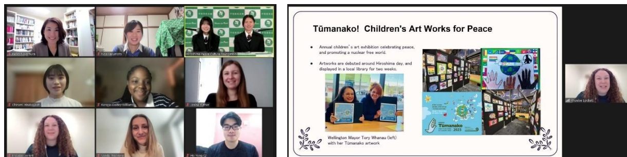
Aperçu du webinaire

Lors du webinaire de cette année, des jeunes leaders engagés dans des activités de paix dans le monde entier ont présenté leurs activités et ont échangé leurs opinions sur les défis auxquels ils sont confrontés, ainsi que sur les activités futures potentielles.