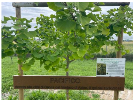
Ginkgo Biloba "Pacifico"