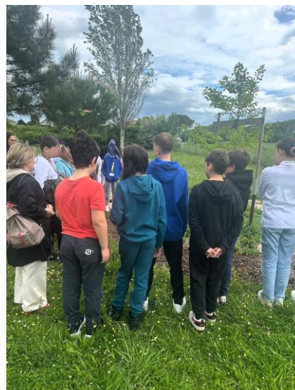
Les enfants dans le parc "Rondano Dondini"

Ce sont les raisons qui nous ont amenés à adhérer au Mouvement international de la bonté et à proclamer l'école Buonarroti "Scuola Gentile". Nous nous engageons à respecter les valeurs fondamentales du pardon, de l'optimisme et de la gentillesse.